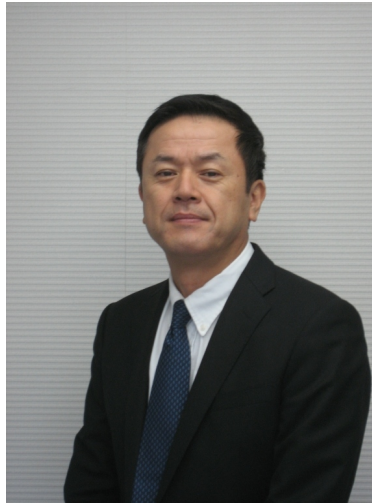
สารจากประธานกรรมการ ประจำปี 2021